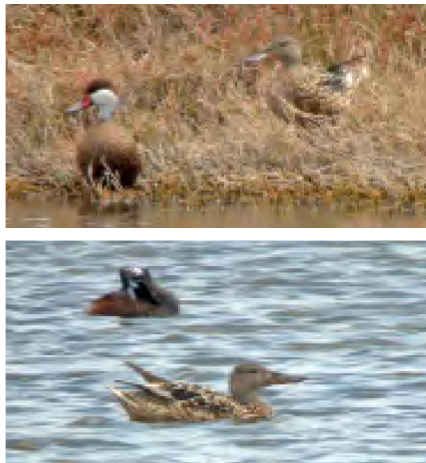
Fig. 1 & 2: Anas clypeata ; Pato Cuchara Norteño; Northern Shoveler.

La inclusión de esta especie en la lista de aves de Perú fue aprobada con nueve votos a favor, ningún voto en contra y dos abstenciones.