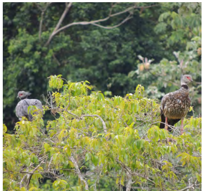
Figura 10: Chauna torquata ; Gritador Chajá; Southern Screamer.

On December 8, 2012, at Lake Pastora Grande, Comunidad Tres Islas, Province of Tambopata, Department of Madre de Dios. Andy Arcco observed in lake shore vegetation, two individuals of the species Chauna torquata in the top of a tree.