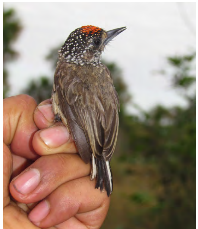
Figura 1 & 2: Picumnus albosquamatus ; Carpinterito Escamado; White-wedged Piculet.