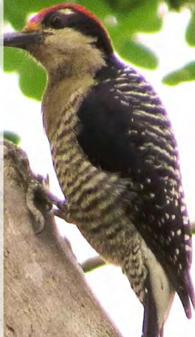
Individuo macho de Carpintero de Cara Negra ( Melanerpes pucherani ) en el Parque Nacional Cerros de Amotape.

Bibliografía de las Aves del Perú 2012. Manuel A. Plenge: 77 - 84