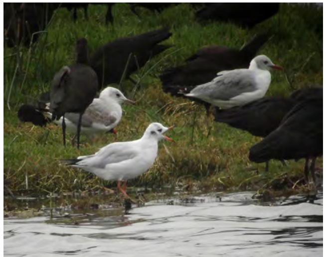
Figura 8 & 9: Chroicocephalus maculipennis ; Gaviota de Capucha Café; Brown-hooded Gull.