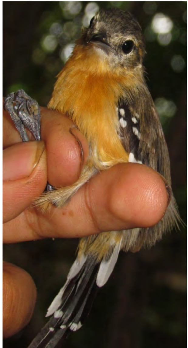
Figura 3,4 & 5: Formicivora grisea ; Hormiguerito de Pecho Negro; White-fringed Antwren.

Entre el 3 y el 5 de julio de 2012, Daniel Cáceres Apaza y otros integrantes de una expedición del Museo de Historia Natural de la Universidad Nacional de San Agustín de Arequipa, fotografiaron y colectaron dos ejemplares (una hembra adulta y un macho de edad indeterminable) de Formicivora grisea en el Parque Nacional Bahuaja Sonene, Pampa Juliaca, Pampas del Heath, provincia de Tambopata, departamento de Madre de Dios.